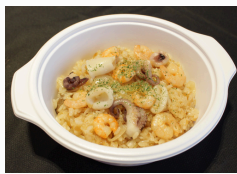
シーフードピラフ