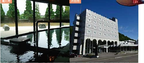
滝川ふれあいの里 花見の設備の備わったリゾート施設。キッズ体験やワークショップなど、様々なアクティビティが楽しめます。

旅の手をさっぱりと流すもよし、のんびりと名湯めぐりを楽しむもよし。東空知には、心も体もリフレッシュできる個性豊かな温泉が揃っています。