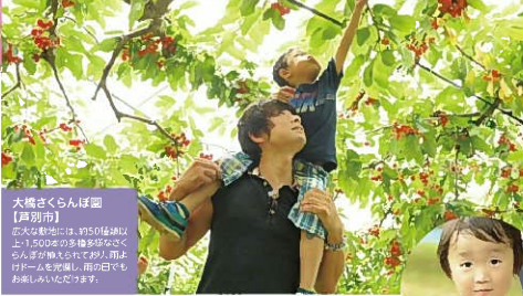
大橋ざくらんぼ園 【昇別市】 大橋ざくらんぼ園は、約50haの園地で、約1,500本のさくらんぼの木が植えられています。おもむきで収穫し、新鮮なブルーベリーをお楽しみいただけます。