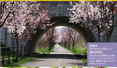
桜並木 サウザンロード 【歌志内市】 3月上旬、桜の花は満開。舞やぬいぐるみと桜のトンネルをくぐりながら、感動的な景色が広がります。