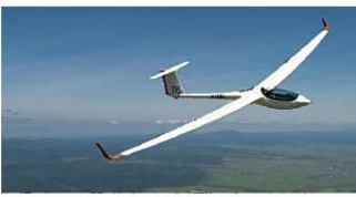
グライダー体験 【滝川市】 滑るよう滑らかに空を飛び、大地の恵みを感じながら飛行を楽しめます。

自分の手で収穫した満ちた大地の恵みで、自分で採った高野の味噌は特別です。グライダーやサイクリングなど、東空知の魅力を堪能してください。