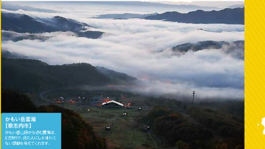
かまい岳雲海 【歌志内市】 かまい岳の山頂から見える雲海は、まるで天上世界を歩いているような気持ちになります。

雄大な自然を眺めたり、美しい風景を堪能したり、歴史や文化を感じる。東空知が誇る多彩な観光スポットを、ゆっくり堪能してください。