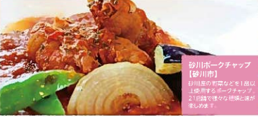
砂川ポークチャップ 【砂川市】 砂川市の伝統的な料理。ポークチャップは、2日間じっくりと焼かれ、風味が独特です。