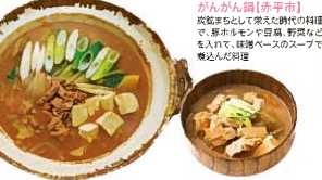
がらんご(赤平市) 鹿肉を中心とした肉料理。鹿肉の旨味と野菜の甘さを生かした健康なレシピです。