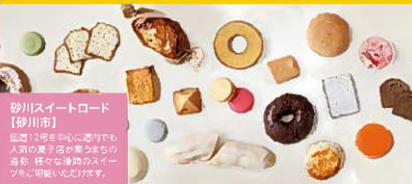
砂川スイーツロード 【砂川市】 道沿い2kmに渡り、地元の人々の手作りスイーツが楽しめる。様々な種類のスイーツが揃っています。