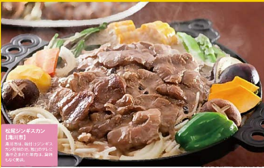
松尾ジンギスカン 【滝川市】 春川村は、新鮮なジンギスカン肉を採る。新鮮な肉と野菜を合わせた肉料理、風味が独特です。